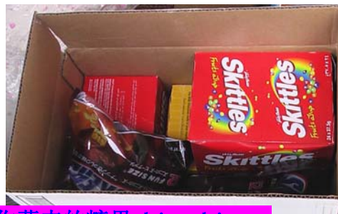
YJ 美女: 谢谢你募来的糖果, kiss kiss~