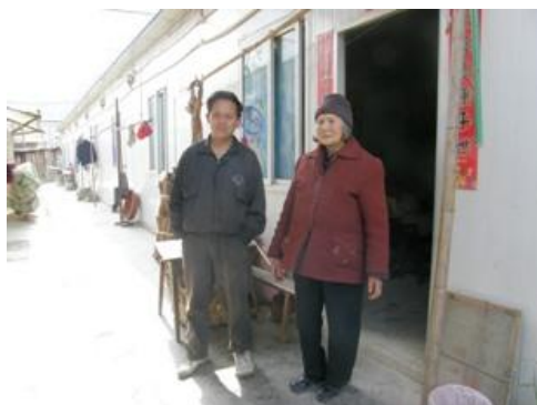
木鱼中学周围居住的板房