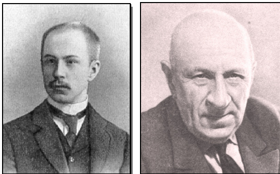
柳比歇夫 А. А. Любичева 1890~1972